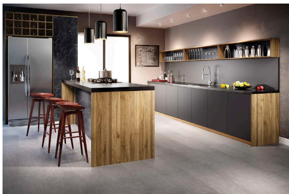
Ilustração - Piso Vinílico Decore Concreto DW 0741