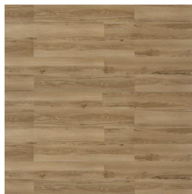
Piso Vinílico Home - Marfim

Não é necessário. O piso vinílico requer alguns cuidados quando se fala de água em abundância. Embora seja feito em PVC, material resistente à água, o excesso de água poderá infiltrar entre as réguas, ocasionando bolor, mal cheiro e conseqüentemente descolamento do piso. Para a limpeza é recomendado o uso da vassoura de pêlo ou um pano úmido com detergente neutro.