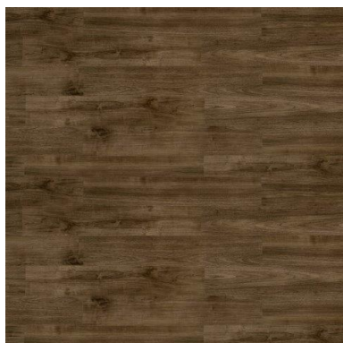
Piso Vinílico Life - Castanho

Caso o piso anterior seja madeira, piso laminado ou carpete têxtil é necessário a remoção. Na opção de cerâmica ou porcelanato recomenda-se o nivelamento do contrapiso com os produtos indicados. Esta operação é importante e necessária para eliminar possíveis irregularidades e posterior descolamento das