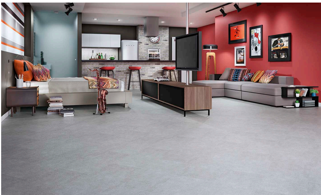
Vinílico Linha Decore Concreto DW0741-baixa

Praticidade, conforto térmico, beleza e rápida instalação são as principais características que as pessoas buscam na hora de escolher o piso para os diferentes ambientes da casa. De fácil manutenção, os pisos vinílicos são, além do piso laminado Eucafloor, a solução perfeita para uma reforma rápida e sem dor de cabeça, desde que um fator muito importante seja respeitado: a preparação da base para a instalação.