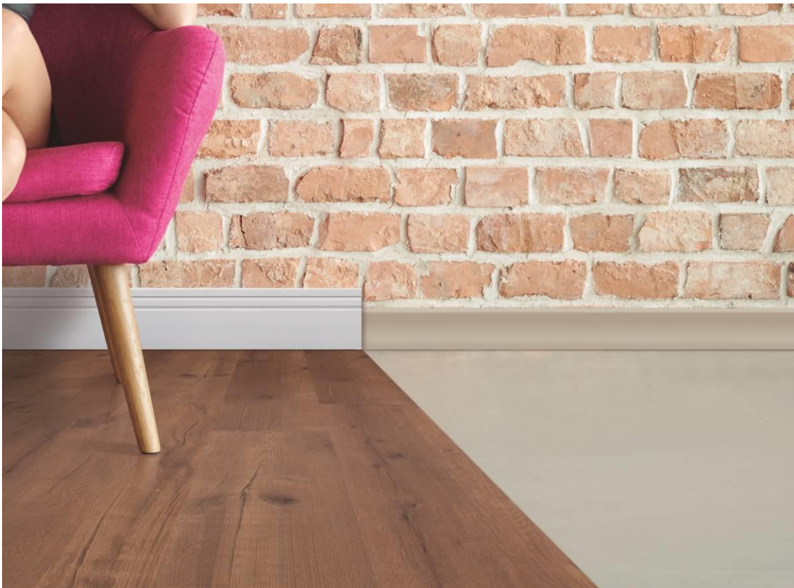
Mudança total: novo rodapé Reveste em harmonia com os pisos Eucafloor

Disponível na cor branca e com frisos, o Reveste tem 12 cm de altura, com área de cobertura de 8,4 cm, ideal para cobrir rodapés tradicionais que possuem altura de até 8 cm. Além disso, é produzido em poliestireno, material 100% reciclável, resistente à água e ao ataque de cupins.