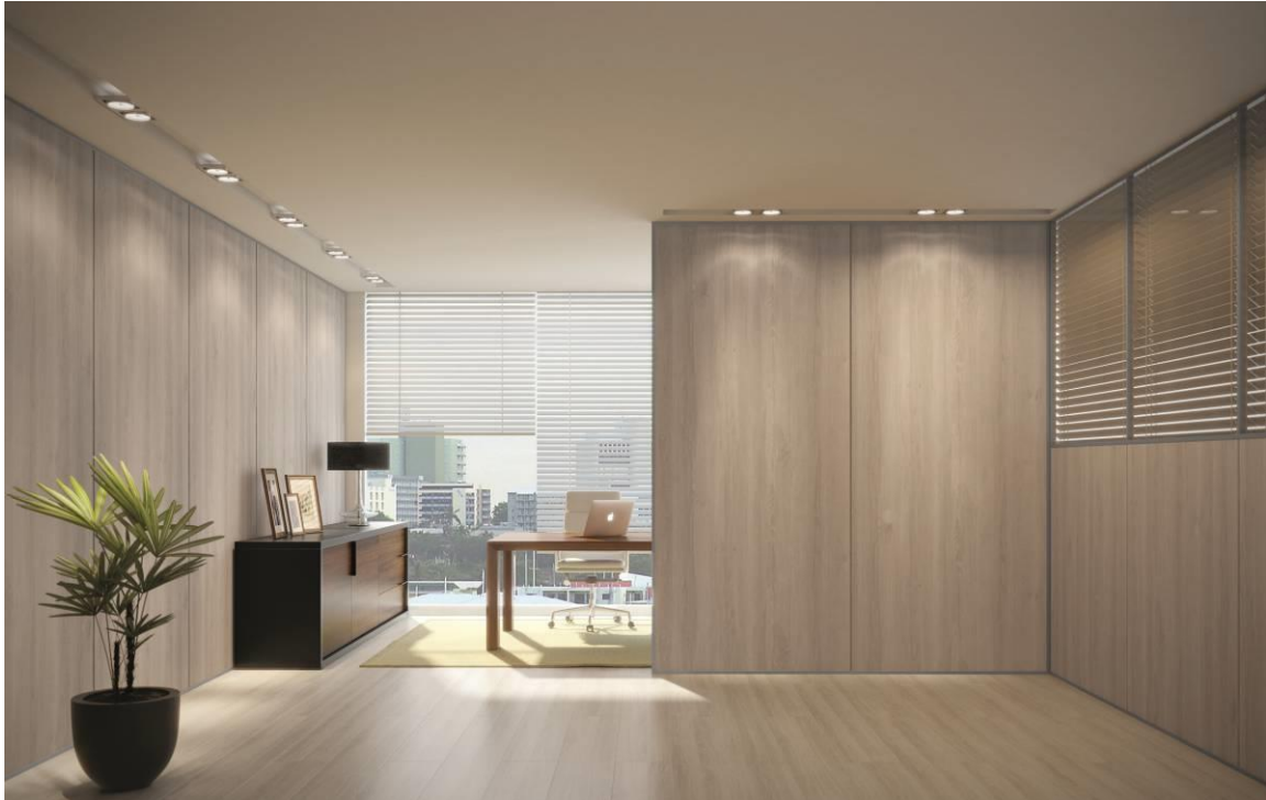
Novitá: um novo conceito em divisórias de ambientes que exigem requinte

Espaços corporativos passam por frequentes mudanças e a utilização das divisórias se mostra uma ótima opção para repaginar o layout de forma rápida e econômica, mas sem abrir mão do requinte. Pensando em trazer mais beleza e funcionalidade para esses locais, a Eucatex lança na Revestir 2017 um novo conceito em divisórias: a Divisória Novitá , que possui um sistema construtivo diferenciado, com painéis inteiros, conferindo um visual mais elegante ao ambiente.