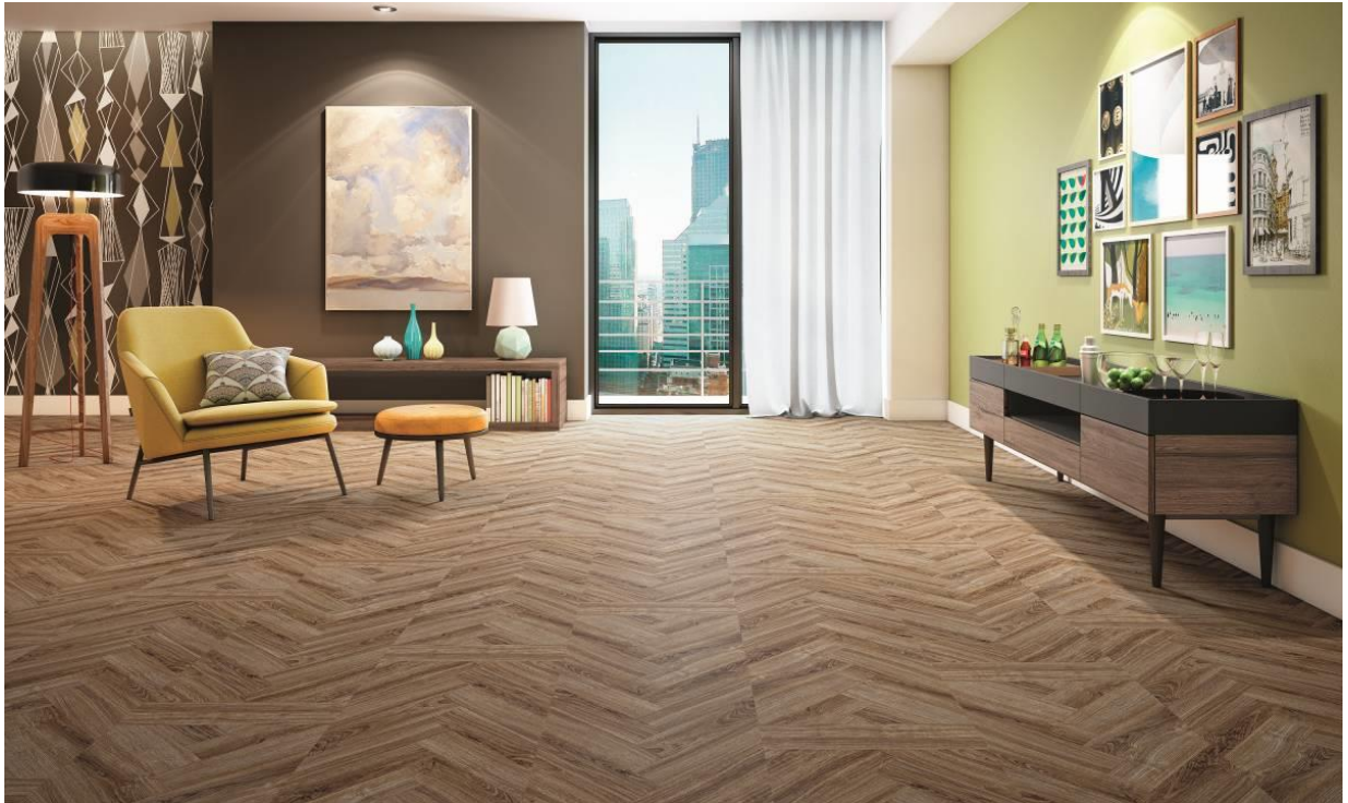
Gran Elegance London: a união do vintage com o contemporâneo

Inovação, tecnologia e muito charme marcam a nova linha dos pisos laminados Eucafloor , a Gran Elegance . Com réguas de 45 cm de largura, a maior do segmento disponível no mercado, a novidade é apresentada no padrão London , que traz o desenho espinha de peixe. Este é o principal lançamento da Eucatex durante a 15ª Expo Revestir , que acontece entre os dias 7 e 10 de março, no Transamerica Expo Center, em São Paulo.